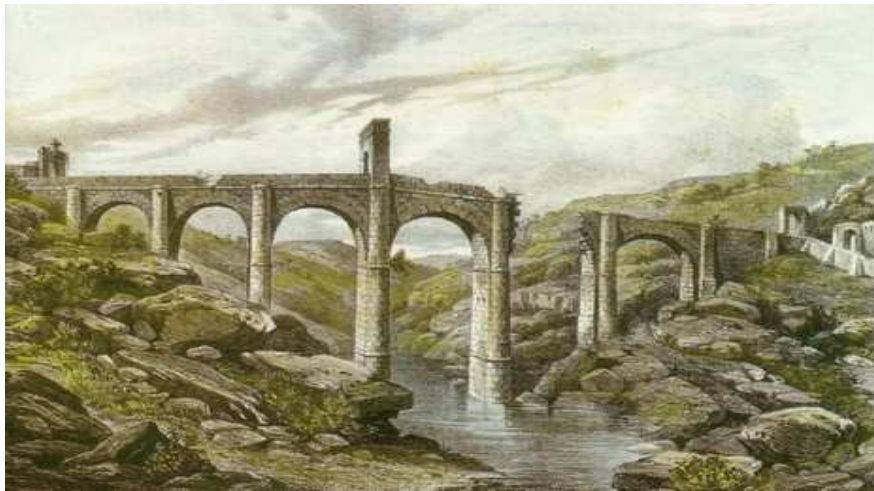
Litografía de Serra-Casals, después de la Guerra de la Independencia

quizás decidió reconstruirlo en vez de hacer uno nuevo, por las sugerencias del ingeniero Fernandez de Pelilla, que en 1841, expresa en un informe: ``aunque cuando sería mucho más sencillo y económico variar su aspecto exterior, no creo en manera alguna variarse el resto del puente, pues sería una disformidad que una parte, presente distinto aspecto y formas que la otra [...]. Siendo este puente una obra monumental que recuerda lo que era este país en los siglos más remotos [...] debe conservarse este monumento a toda costa un monumento que recuerda dicha época y engrandece a este país.'' 3